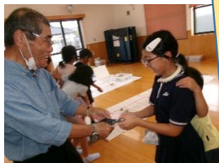
敬老の日プレゼント作り お世話になっている 地域の方へプレゼントしました